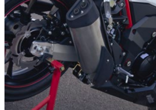
■ Braço oscilante em alumínio