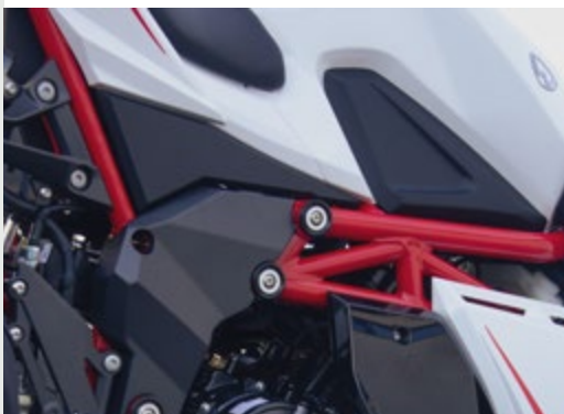
■ Chassis multitubular