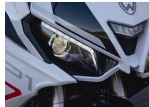
■ Sistema de iluminação potente