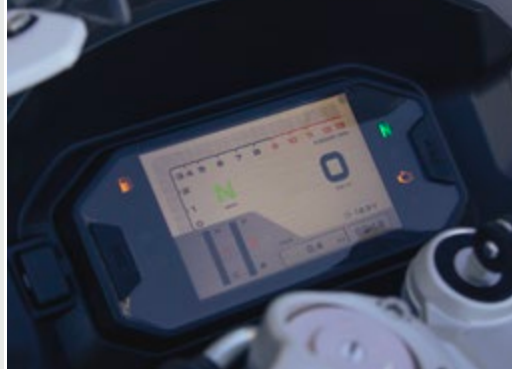
■ Painel de instrumentos digital