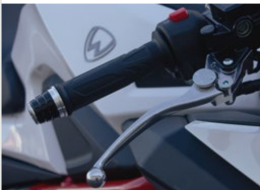
■ Manete de travão regulável